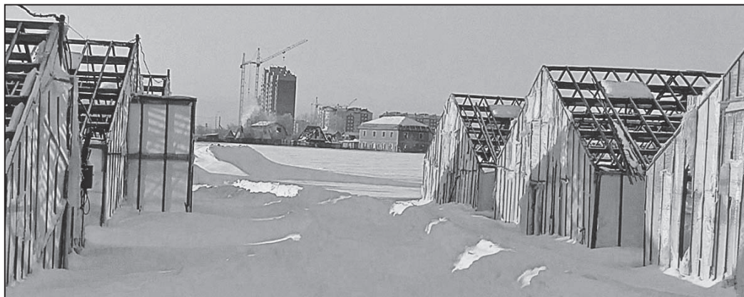
Город, наступая на когда-то колхозные земли, создал проблемы для овощеводов.

- И?... - Сказали, что этот мент - бывший, а они следят за действующими сотрудниками... Вот и все... Хотя не все, нет. Позже при мне следователь Калининского РОВД (теперь уже бывший) звонил этому «посланнику», и, не стесняясь, спрашивала: договорились мы, или нет, что ей в обвинении писать... А еще недавно дочке звонили. И по-